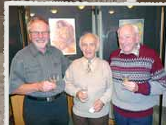
Kniha o historii má pětileté výročí