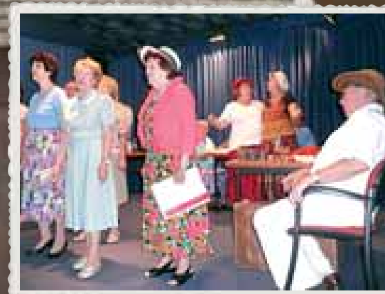
Jazzbáby slavily s kapelníkem