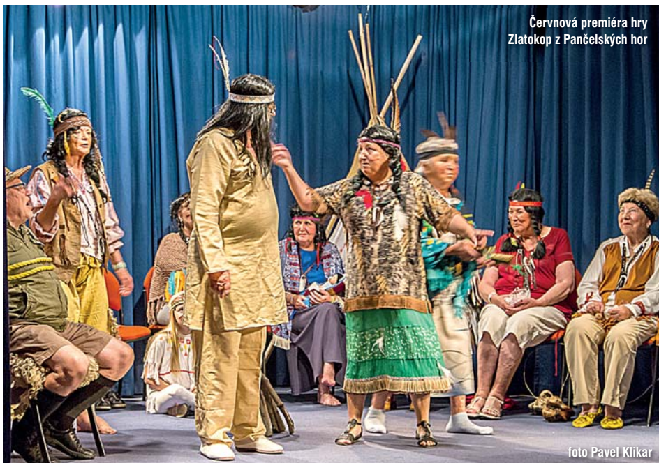
Černová premiéra hry Zlatokop z Pančelských hor