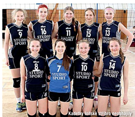
Kadetky loňské stříbro neobhájily

Všechny aktuální informace přineseme v příštím čísle Kolovratského zpravodaje. Držíme všem palce!