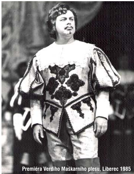
Premiéra Verdiho Maškarního plesu, Liberec 1985

Když jsem působil v šedesátých letech v Karlínském divadle, dostal jsem od kapelníka nabídku hrát v cirkusové kapele Californischer National Circus. Z původních osmi