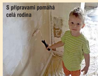
S přípravami pomáhá celá rodina

Určitě necháme na lístku pizzu, to bychom synovi nemohli udělat... A budeme nabízet i čerstvé těstoviny. Nechceme ale „zakotvit“ v italské kuchyni. Kromě stálého jídelního lístku budeme připravovat i speciální nabídky z různých mezinárodních kuchyní.