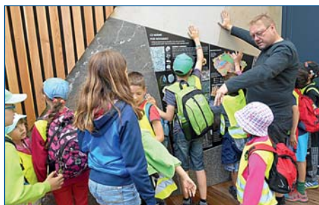
Děti z příměstského tábora nakouklí do říčanského Geoparku a podívali se na Slunce přes hvězdářský dalekohled.