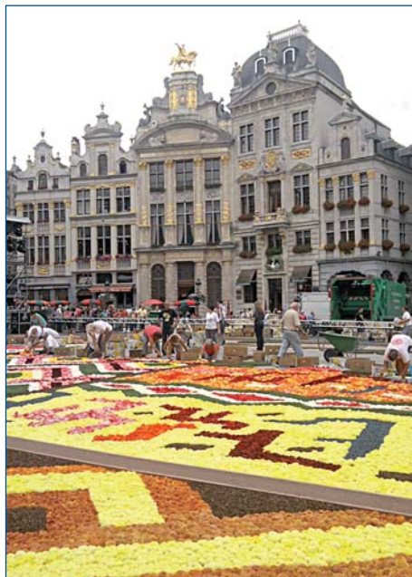
Každý druhý rok v srpnu se promění hlavní bruselské náměstí v květinový koberec utkaný z tisíců květů begonii.

ny, takže i zapeklitou křižovátku s kruhovým objezdem projede cyklista hladce a bezpečně. Navíc v jednosměrných má povoleno jet i v protisměru, projde mu i manévrování mezi auty nebo jízda „na červenou“ a podobně jako chodec na přechodu se těší absolutní přednosti. Před křižovátkou stačí jen lehce přibrzdit a řidič za volantem uctivě zpomalí, aby cyklistovi dal najevo, že o něm ví. U většiny křižovatek platí přednost zprava, což dopravu sice zpomaluje, ale provoz je bezpečnější.