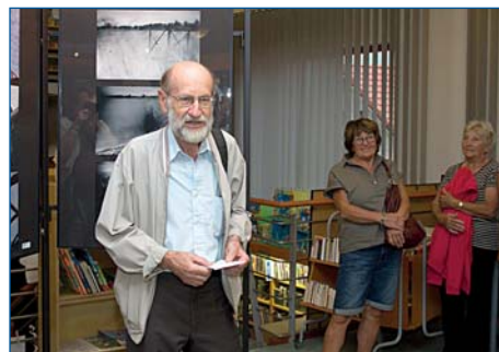
Fotografiím klubu Nekázanka to v Infocentru sluší.