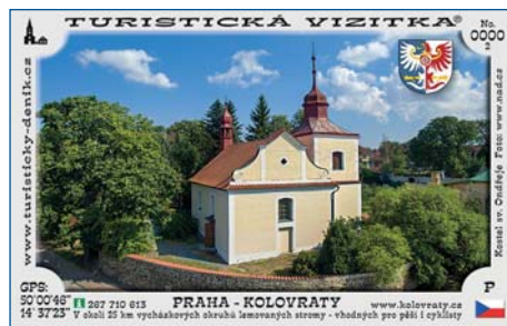
Infocentrum brzy nabídne turistickou vizitku.