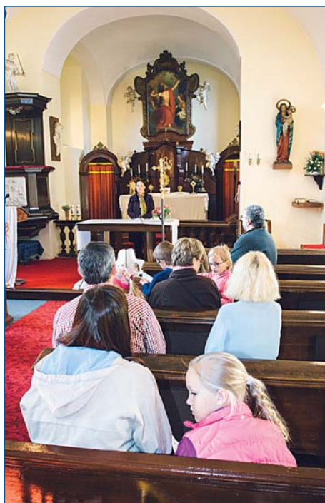
Noc kostelů se v Kolovratech už zabydlela.