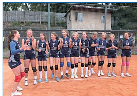
Starší žákyně Studio Sport na VC Prahy