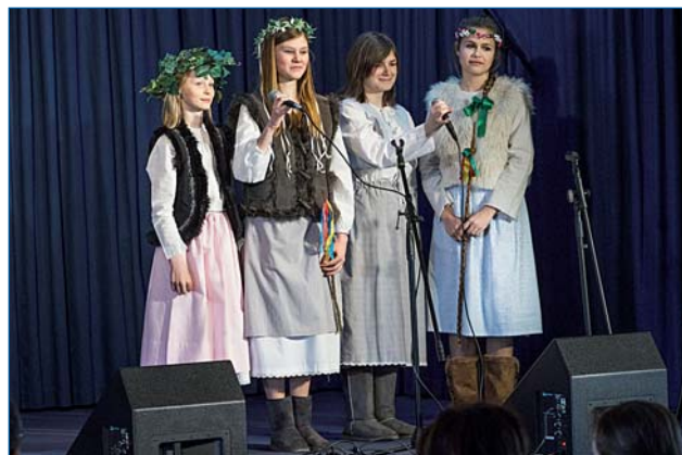
Soubor Coro Piccolo potěšil velikonočním pásmem