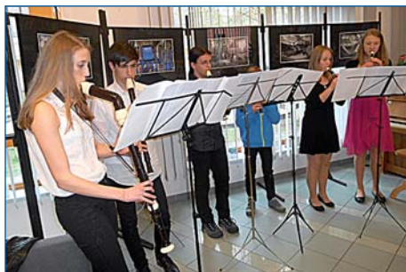
Žáci flétnové a klavírní školy pobočky ZUŠ svoje nástroje ovládají bravurně