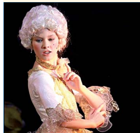
Antoinetta – Královna Francie