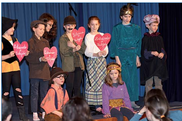
Malí divadelníci zahráli pohádku Lotrando a Zubejda