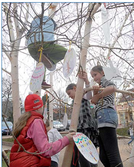
Na Velikonoce ozdoby děti z kroužku Pastelka břízku před infocentrem