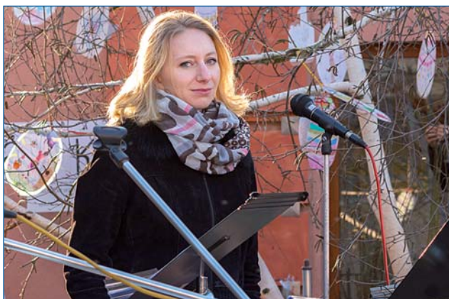
Soubor Církve bratrské připomenul duchovní obsah svátků