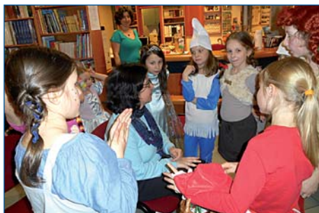
Noc s Andersenem si děti užily i letos, tentokrát ve stylu oslav 50 let Večerníčku