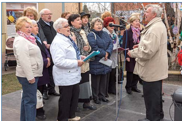
JazzBáby nemohou chybět na žádném z jarmarků