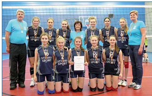
Stříbrné kadetky Studia Sport v Přeboru Prahy