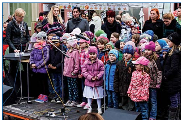
Předškoláci pobavili publikum před Infocentrem