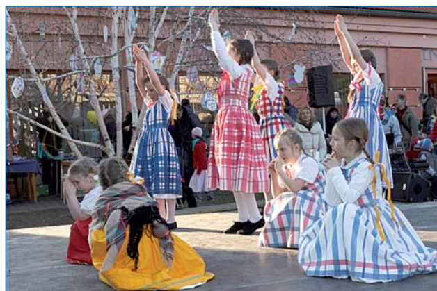
Dětský soubor Vrbina oživil lidové tradice