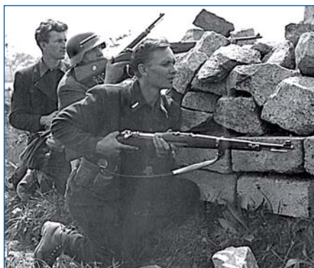
Kolovratští obránci barikády u kutnohorské silnice 6. 5. 1945