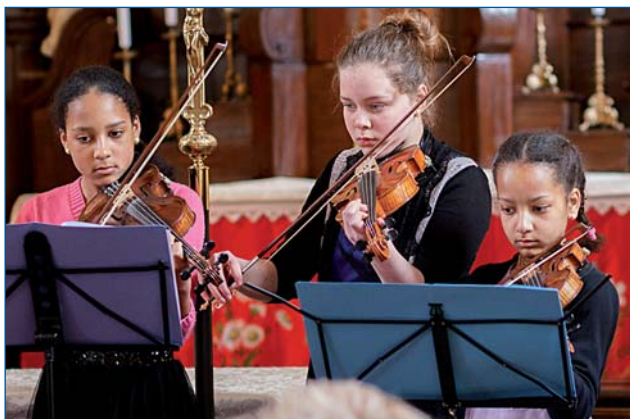
Jarmark otevřel koncert žáků ZUŠ v kostele