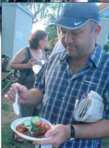
Lipanští koncem prázdnin předvedli, že mají vztah k tradiční kuchyni, obdivují silné stroje, dovedou vzdát hold veteránům a pro recesi nemusí chodit daleko.