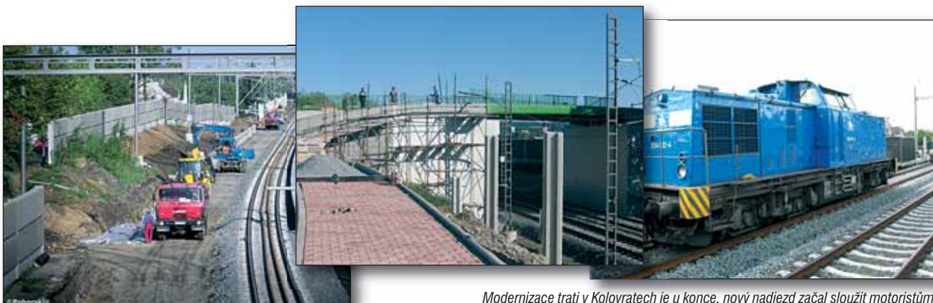
Modernizace trati v Kolovratech je u konce, nový nadjezd začal sloužit motoristům.