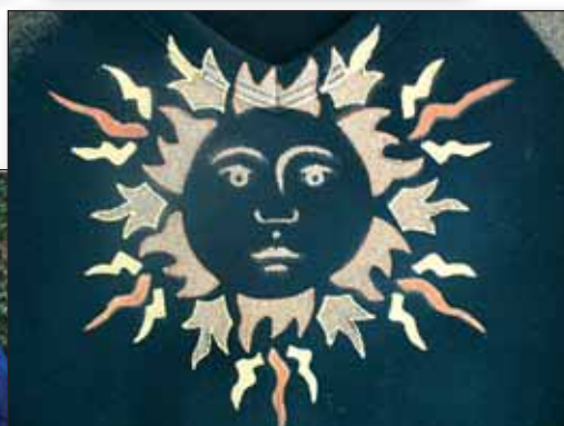
Kolovratské Tvořeníčko úspěšně rozběhlo v Infocentru kurzy pro všechny ženy a dívky, které dávají přednost vlastnoručně zhotovenému šperku či originálnímu bytovému doplňku.