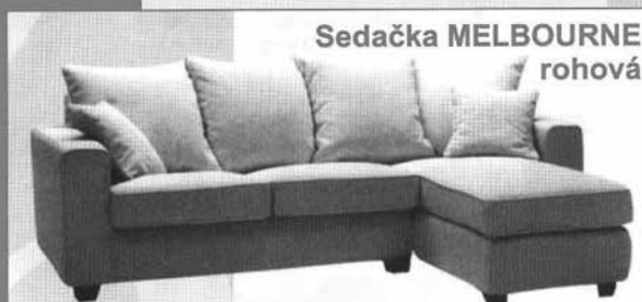
Sedačka MELBOURNE rohová

TUSCULUM • JITONA BÖHM • AHORN • ENOZZI PF nábytek • JECH • TROPICO DŘEVOTVAR