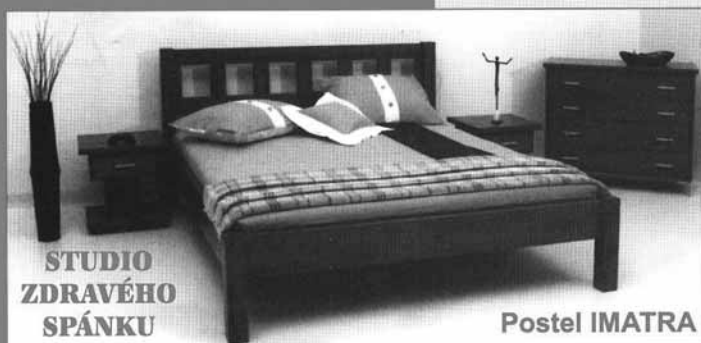
STUDIO ZDRAVÉHO SPÁNKU